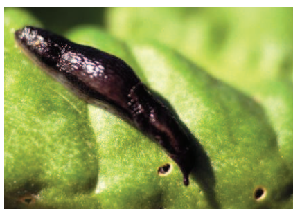
Limace noire horticole