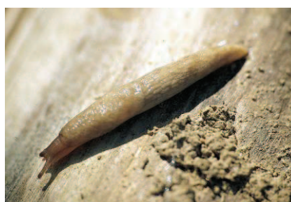
Limace grise ou « loche »